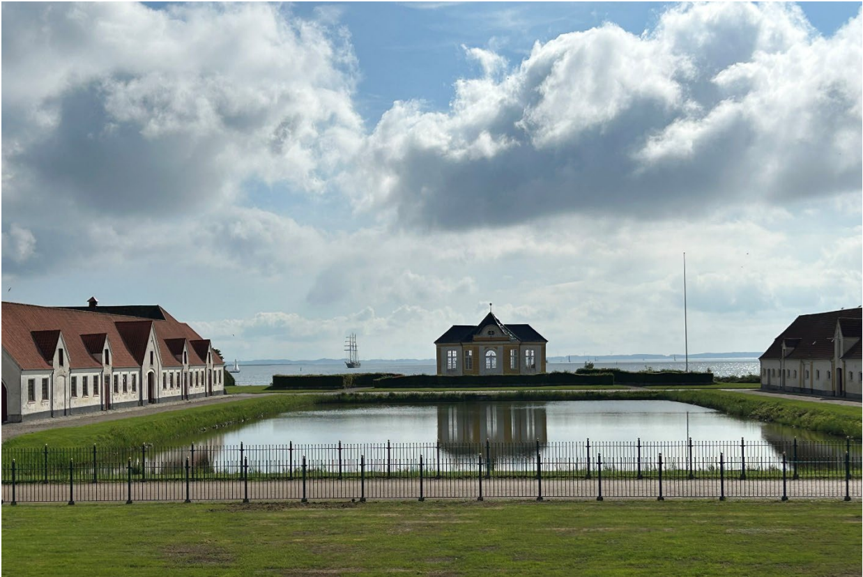
Den centrale barokhave